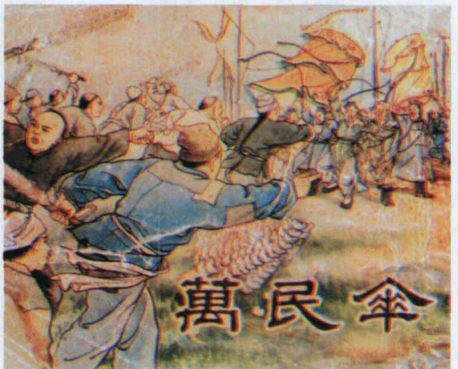
图 徐宏达 《万民伞》