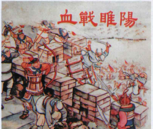
图 赵三岛 《血战睢阳》